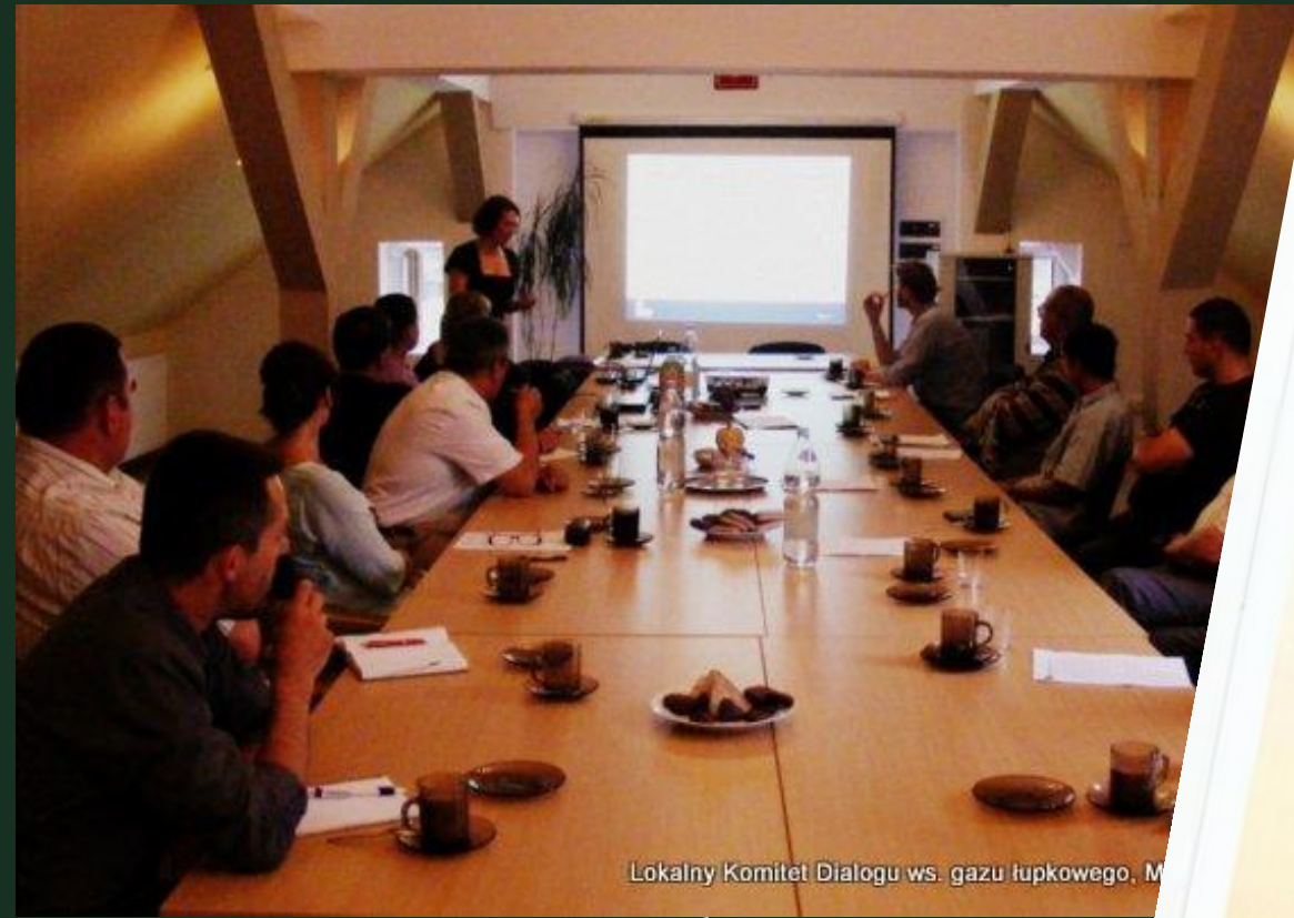
Lokalny Komitet Dialogu ws. gazu łupkowego, M